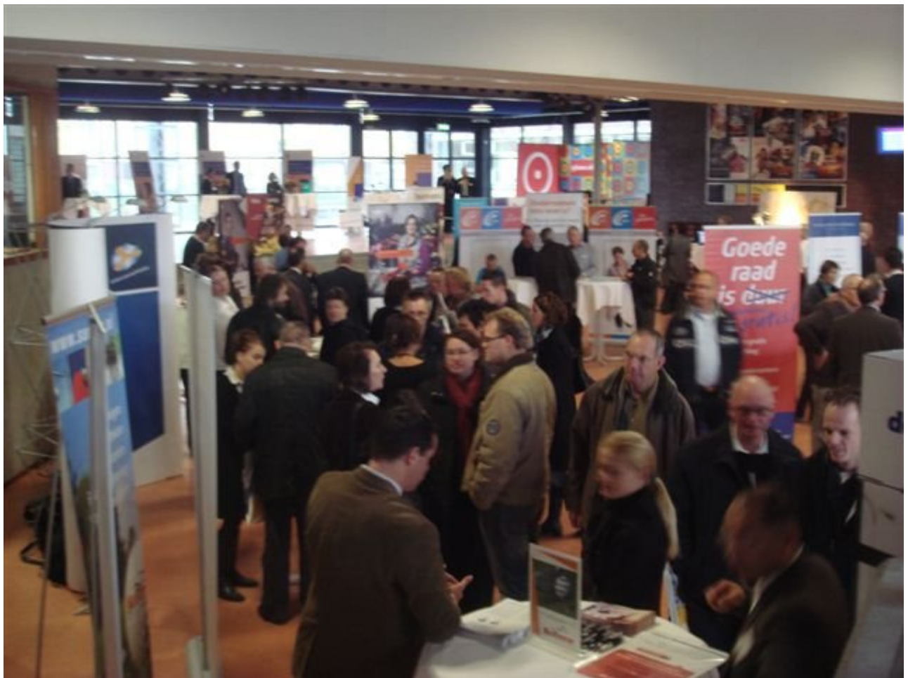
Startersdag 1 november 2008, Technodôme Venlo